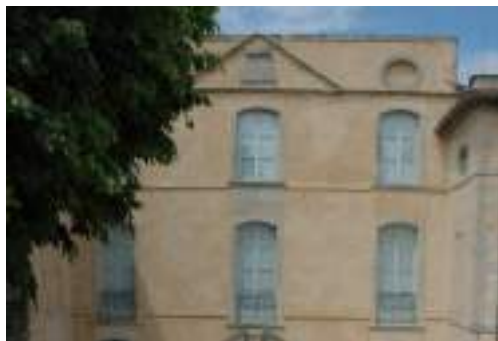
Espace Jean-Baptiste Niel Place Jean Pagnol 84600 Valréas