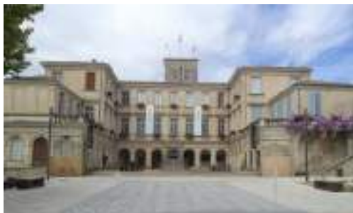
Château de Simiane Place Aristide Briand 84600 Valréas