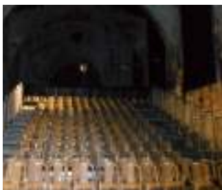
Théâtre des cordeliers 32 rue des cordeliers 84600 Valréas