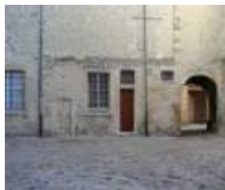
Espace René Jauneau Cour du Château de Simiane 84600 Valréas