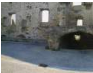
Place Emile Colongin 84600 Grillon