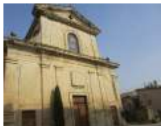
Place de l'Eglise 84600 Richerenches