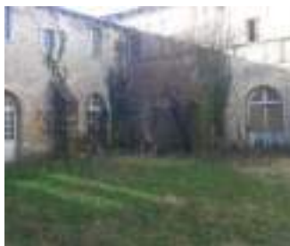
Cloître des Cordeliers rue du berteuil 84600 Valréas