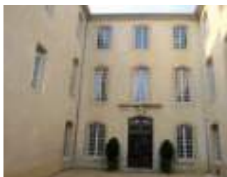
Cour de l'Hôtel de Pélissier 84820 Visan