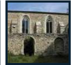
Cloître Des Cordeliers Rue du Bertheuil 84600 Valréas