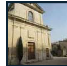
Place De l'Église 84600 Richerenches