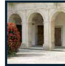
Salle des réunions Hôtel de Ville Place Aristide Briand 84600 Valréas