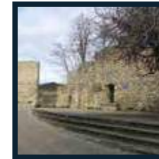
Place Humbert II 84820 Visan