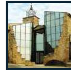
Place Émile Colongin 84600 Grillon