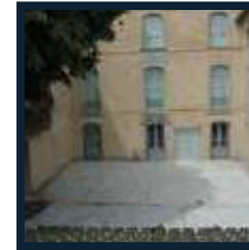
Espace Jean-Baptiste Niel Place Jean Pagnol 84600 Valréas